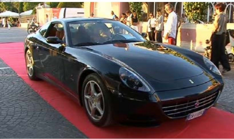
FERRARI 612 SCAGLIETTI - 2005 Premio ctg. SUPERCAR e BEST OF SHOW