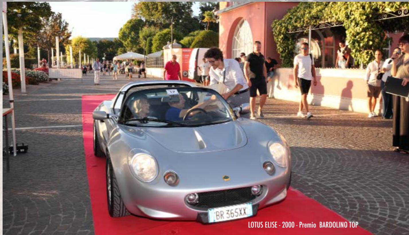
LOTUS ELISE - 2000 - Premio BARDOLINO TOP