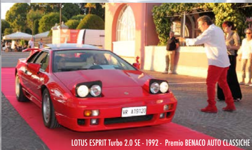
LOTUS ESPRIT Turbo 2.0 SE - 1992 - Premio BENACO AUTO CLASSICHE