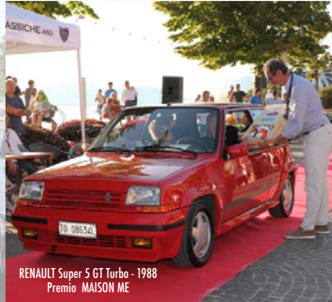
RENAULT Super 5 GT Turbo - 1988 Premio MAISON ME