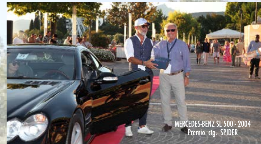
MERCEDES-BENZ SL 500 - 2004 Premio ctg. SPIDER