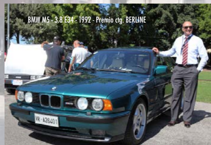
BMW M5 - 3.8 E34 - 1992 - Premio ctg. BERLINE