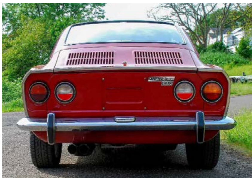
Qui sopra una Fiat Abarth 1000, a sinistra e nella pagina a destra, la Sport Coupé 2 a serie e in basso la 3 a ed ultima serie