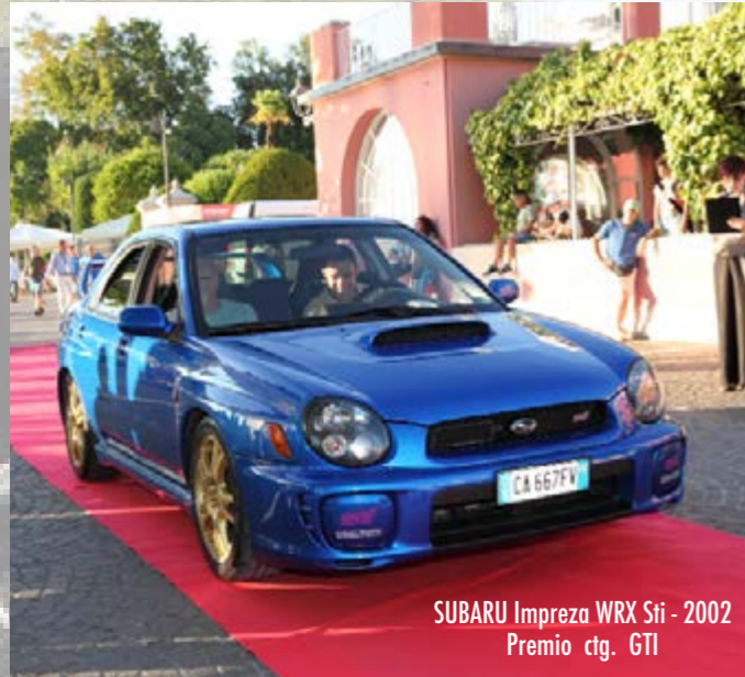
SUBARU Impreza WRX Sti - 2002 Premio ctg. GTI