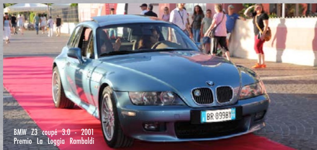
BMW Z3 coupé 3.0 - 2001 Premio La Loggia Rambaldi