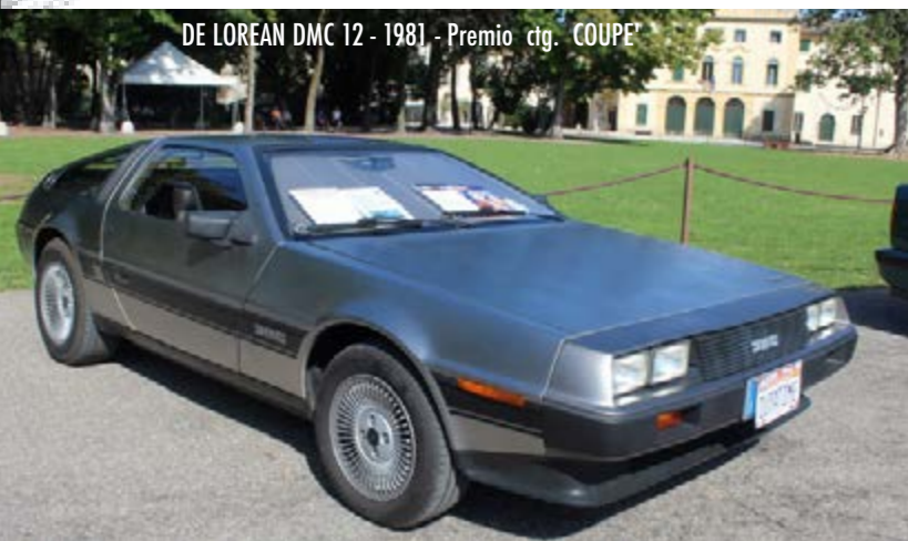
DE LOREAN DMC 12 - 1981 - Premio ctg. COUPE'