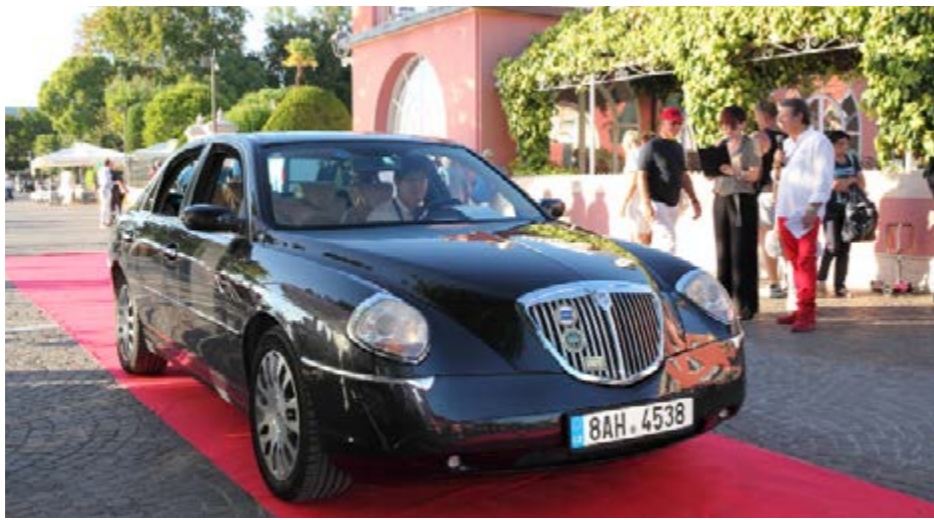
LANCIA THESIS 2.4 JTD - 2004 Premio COMUNE DI BARDOLINO