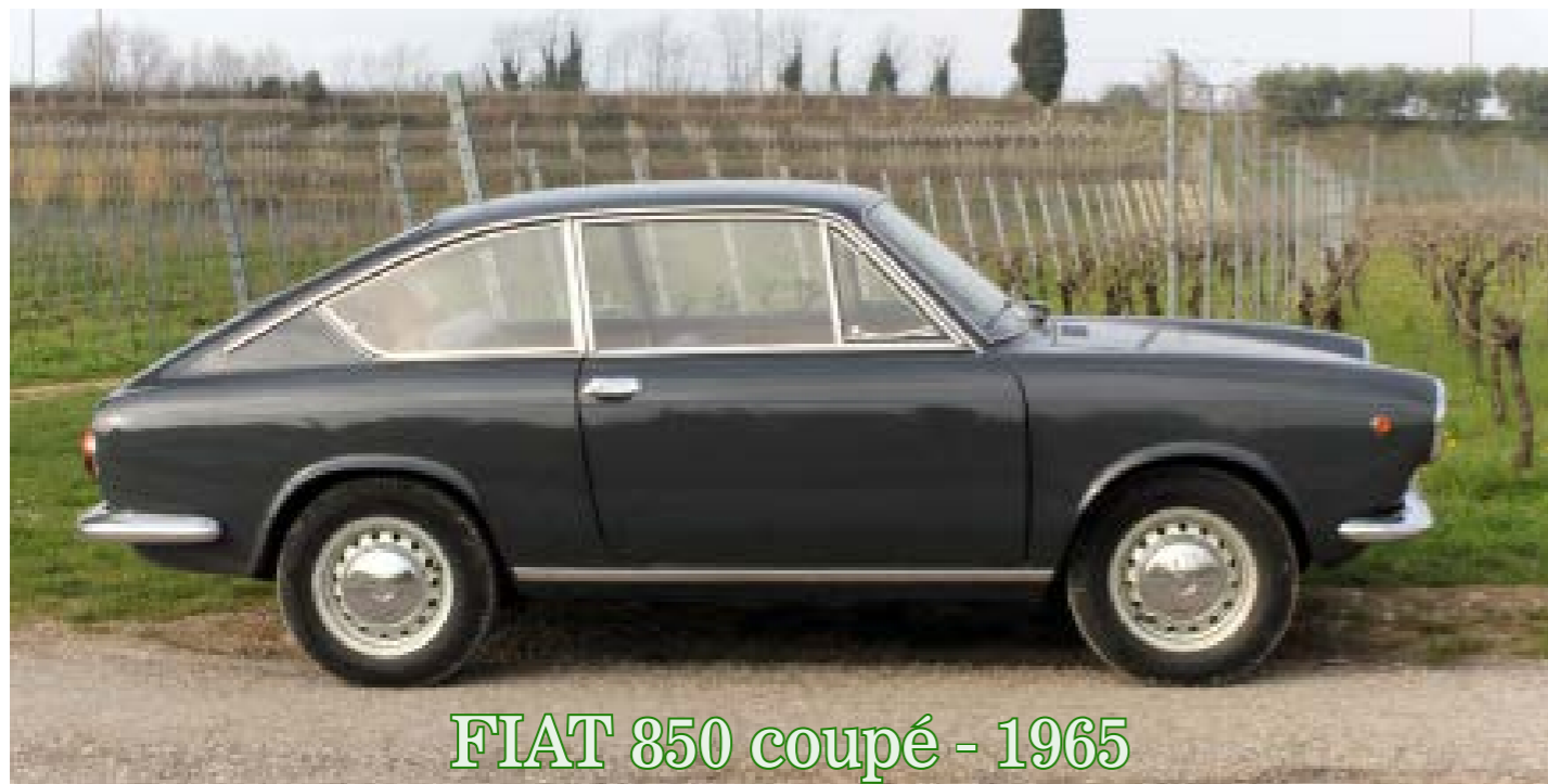
FIAT 850 coupé - 1965

Quando la Fiat 850 Coupé venne presentata al Salone dell'Automobile di Ginevra l'11 marzo 1965, nessuno poteva immaginare che quella piccola utilitaria sportiva avrebbe lasciato un segno così profondo nella storia dell'automobile italiana. Disegnata da Dante Giacosa e dal Centro Stile Fiat sotto la guida di Mario Boano, la 850 Coupé rappresentò la perfetta fusione tra eleganza, funzionalità e piacere di guida in un formato accessibile a tutti. La prima serie della Fiat 850 Coupé (1965-1968) derivava meccanicamente dalla berlina, ma con sostanziali affinamenti. Il motore Tipo 100 GC, quattro cilindri da 843 cm 3 , sviluppava 47 CV a 6.500 giri/min, consentendo alla vettura di raggiungere una velocità massima di 135 km/h. La trazione posteriore e un peso inferiore ai 700 kg garantivano agilità e doti dinamiche sorprendenti per una piccola "gran turismo". Lo stile, firmato da Boano, si distingueva per le linee sobrie e proporzionate, una carrozzeria lunga 3,6 metri e un profilo da piccola GT, con fari doppi anteriori e un posteriore pulito. Gli interni, curati nei dettagli, offrivano un cruscotto con inserti in legno, un quadro strumenti "racing" a due grandi quadranti in stile Ferrari anni '50 e sedili sportivi in skai, reclinabili per accedere al piccolo divanetto posteriore. La 850 Coupé conquistò